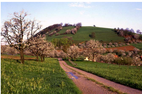
Landschaftsprägende Hochstammobstbäume bei Mandach