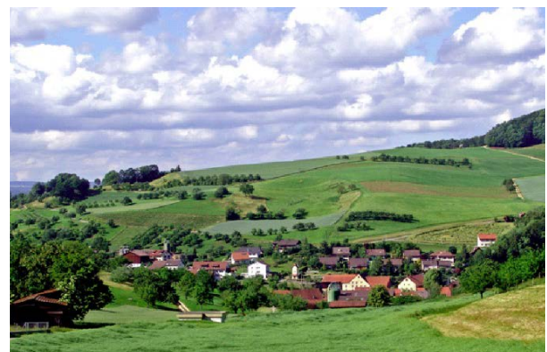
National bedeutendes Ortsbild Ittenthal