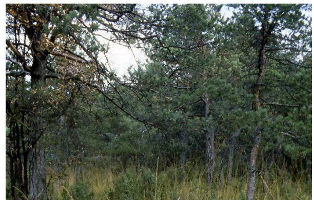
Pfeifengras-Föhrenwälder auf mergelreichen Hanglagen