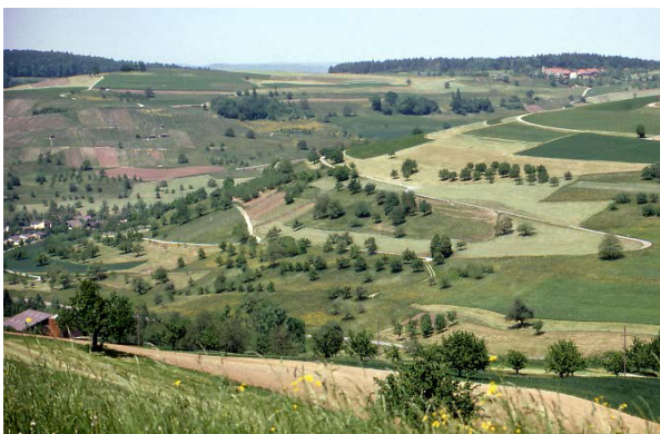
Mosaik von Rebbergen, Obstgärten, Hecken, Wiesen und Äckern bei Wil